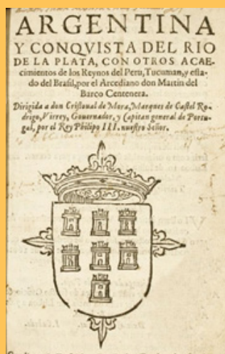
Portada de la primera edición del poema, de 1602.

El río que llamamos Argentino, del indio Paraná o mar llamado, de norte a sur corriendo su camino en nuestro mar del norte entra hinchado. Parece en su corriente un torbellino, o tiro de arcabuz apresurado. Mas con el viento sur plácidamente se vence navegando su corriente.