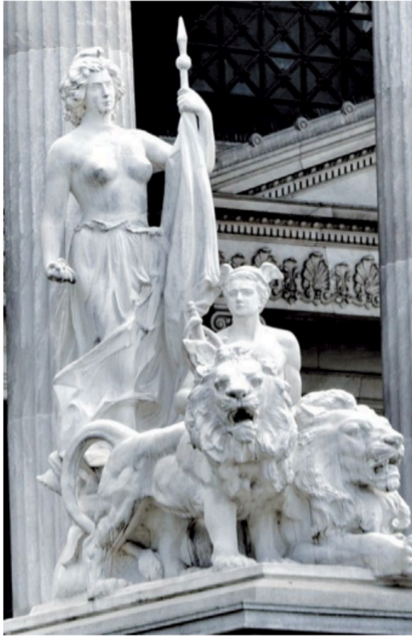
La Libertad, el Progreso y los leones. Grupo escultórico cercano a la calle Hipólito Yrigoyen.