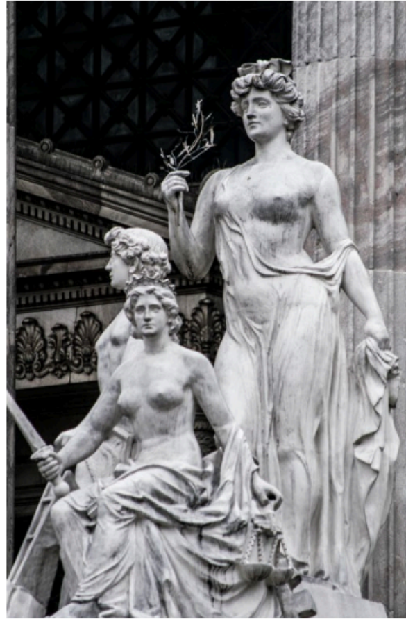
La Paz, la Justicia y el Trabajo. Grupo escultórico cercano a la avenida Rivadavia.